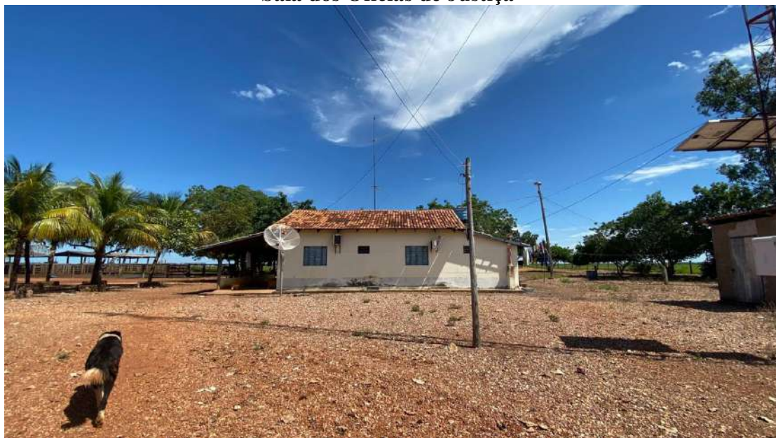
Casas para caseiros (duas iguais)