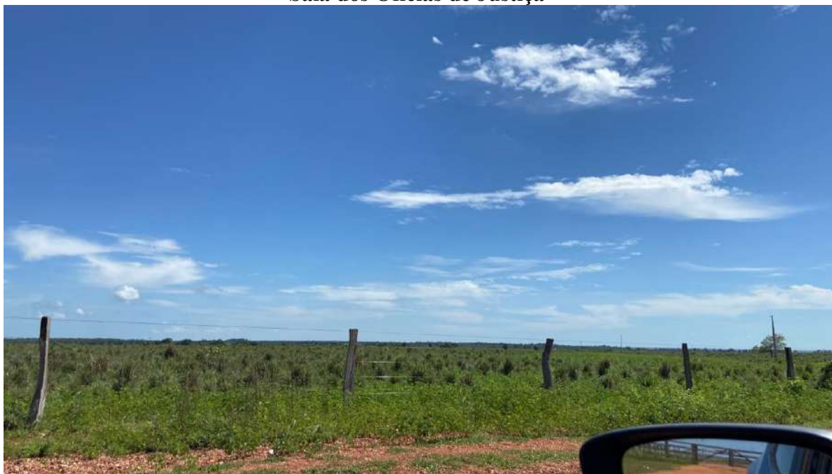
Pastos da propriedade.