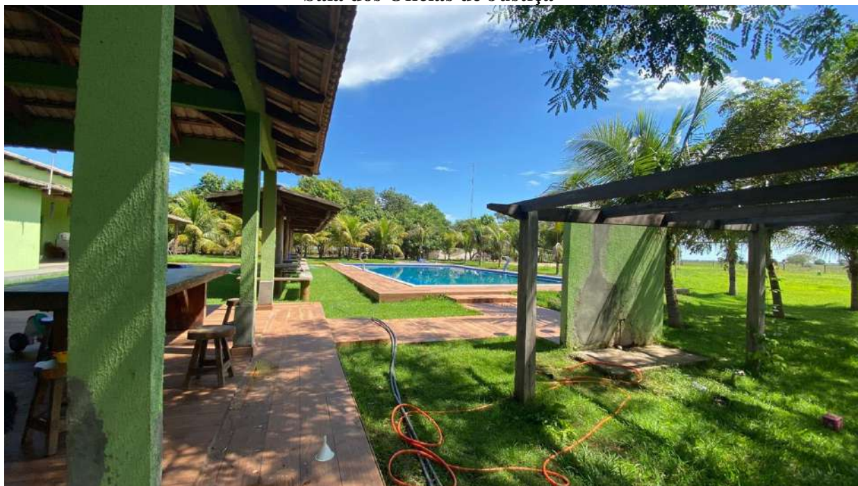
Área de lazer sede.