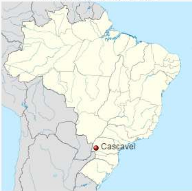
Localização de Cascavel no Brasil