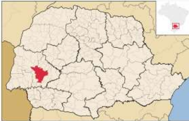
Localização de Cascavel no Paraná