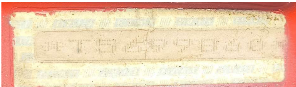
Etiqueta destrutível com a sequência SIV