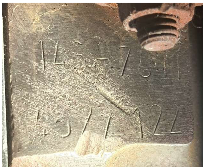
Sequência identificadora do motor

Este laudo foi assinado digitalmente. Para verificação de sua autenticidade, caso impresso, a autoridade deverá efetuar o acesso através do portal http://www.policiacientifica.pr.gov.br e realizar o download do PDF assinado para comparação. Laudo gerado em 03/07/2025 às 22:11:46.