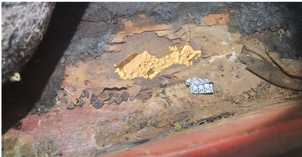
Superfície suporte de gravação da sequência alfanumérica do VIN