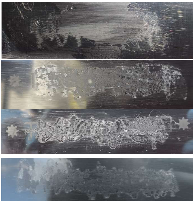
Vidros com a sequência SIV destruída