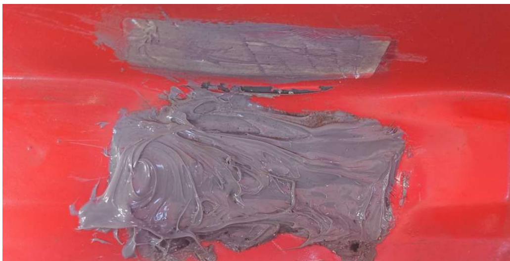
Etiqueta destrutível no compartimento do motor destruída

A reprodução deste documento somente é permitida na íntegra, sendo proibida a reprodução parcial.