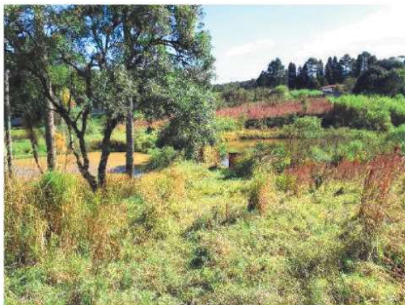
Panorâmica da vista 4-5