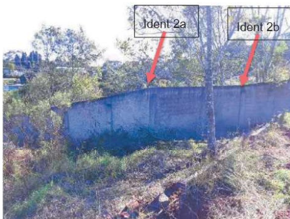
identificação do ponto 2