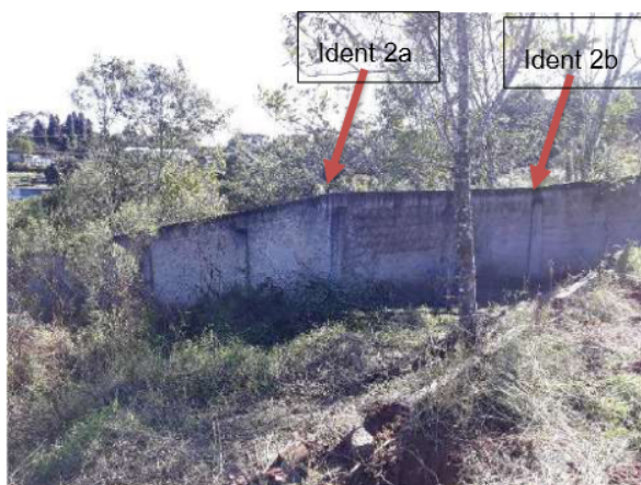
identificação do ponto 2