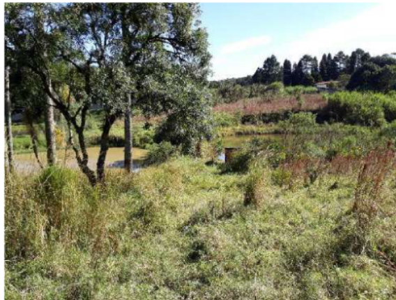
Panorâmica da vista 4-5