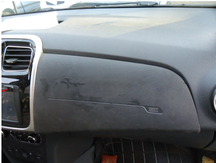
Fotografia 04: Imagem da região direita do painel do veículo.

Este laudo foi assinado digitalmente. Para verificação da sua autenticidade, caso impresso, a autoridade deverá efetuar o acesso através do portal http://www.policiacientifica.pr.gov.br e realizar o download do PDF assinado para comparação. Laudo gerado em 23/07/2024 às 08:17:01