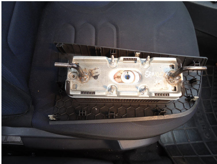
Fotografia 08: Vista interna da tampa do painel do veículo (airbag).

Este laudo foi redigido pela Perita que o subscreve em cinco páginas e é ilustrado com oito fotografias. E são essas as declarações que em sua consciência tem a Perita a fazer. E por nada mais haver, deu-se por findo o exame solicitado que de tudo se lavrou o presente laudo que vai assinado digitalmente pela Perita.