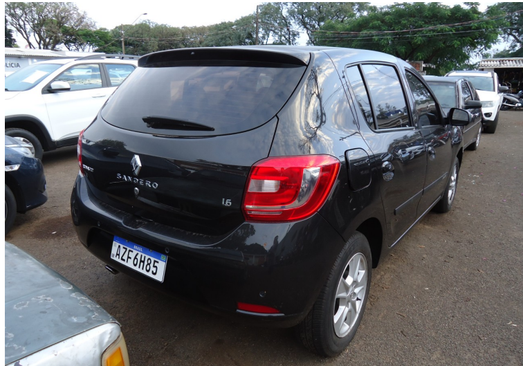
Fotografia 01: Imagem do veículo 01 de que trata o presente laudo.

Imagens do veículo 01 podem ser observadas a seguir.