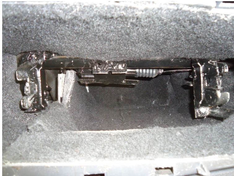
Fotografia 06: Imagem aproximada da região direita do painel (região do airbag ) do veículo, na qual pode ser observada a trava da tampa do painel e o local para a ocultação de drogas.

Este laudo foi assinado digitalmente. Para verificação da sua autenticidade, caso impresso, a autoridade deverá efetuar o acesso através do portal http://www.policiacientifica.pr.gov.br e realizar o download do PDF assinado para comparação. Laudo gerado em 23/07/2024 às 08:17:01