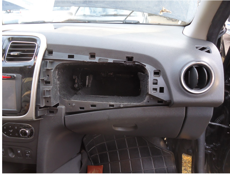
Fotografia 05: Imagem da região direita do painel do veículo.