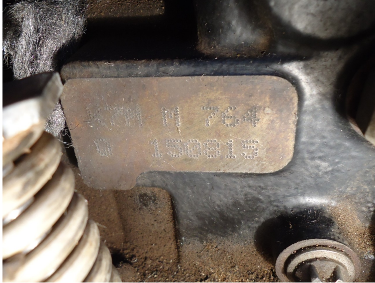
Fotografia 03: Imagem da numeração de motor.