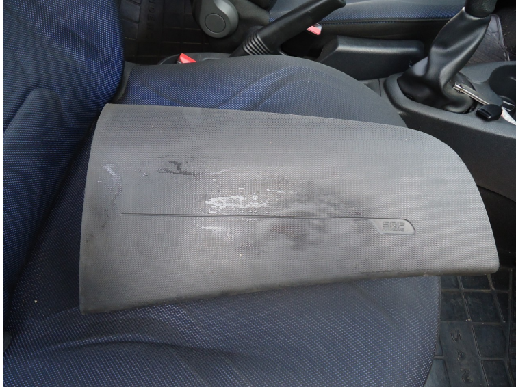
Fotografia 07: Vista externa da tampa do painel do veículo (airbag).