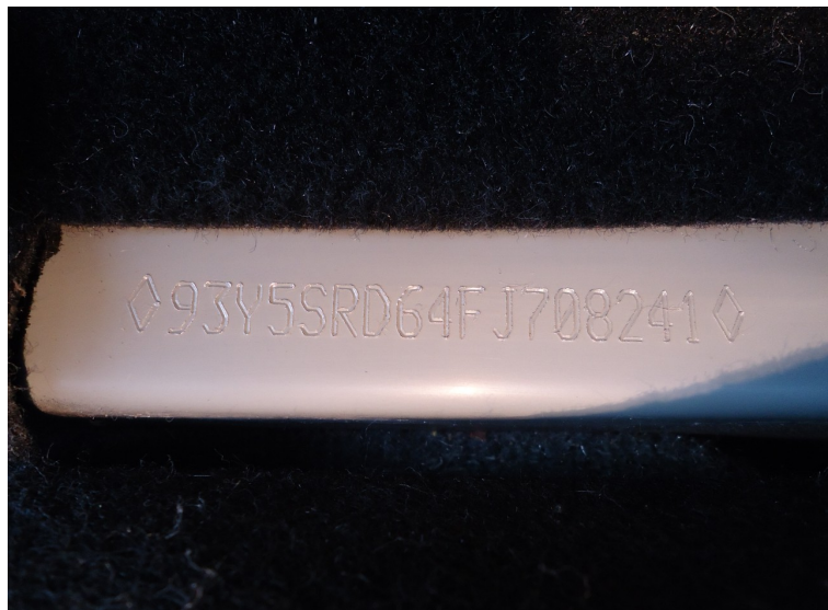
Fotografia 02: Imagem da numeração de chassi.