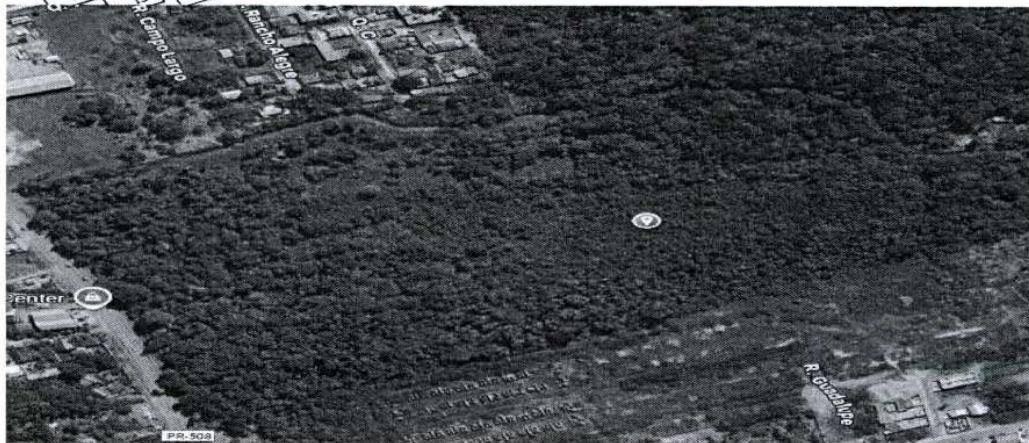
Lote vago e sem acesso, a cerca de 2,1km de distância do centro de Matinhos/PR.