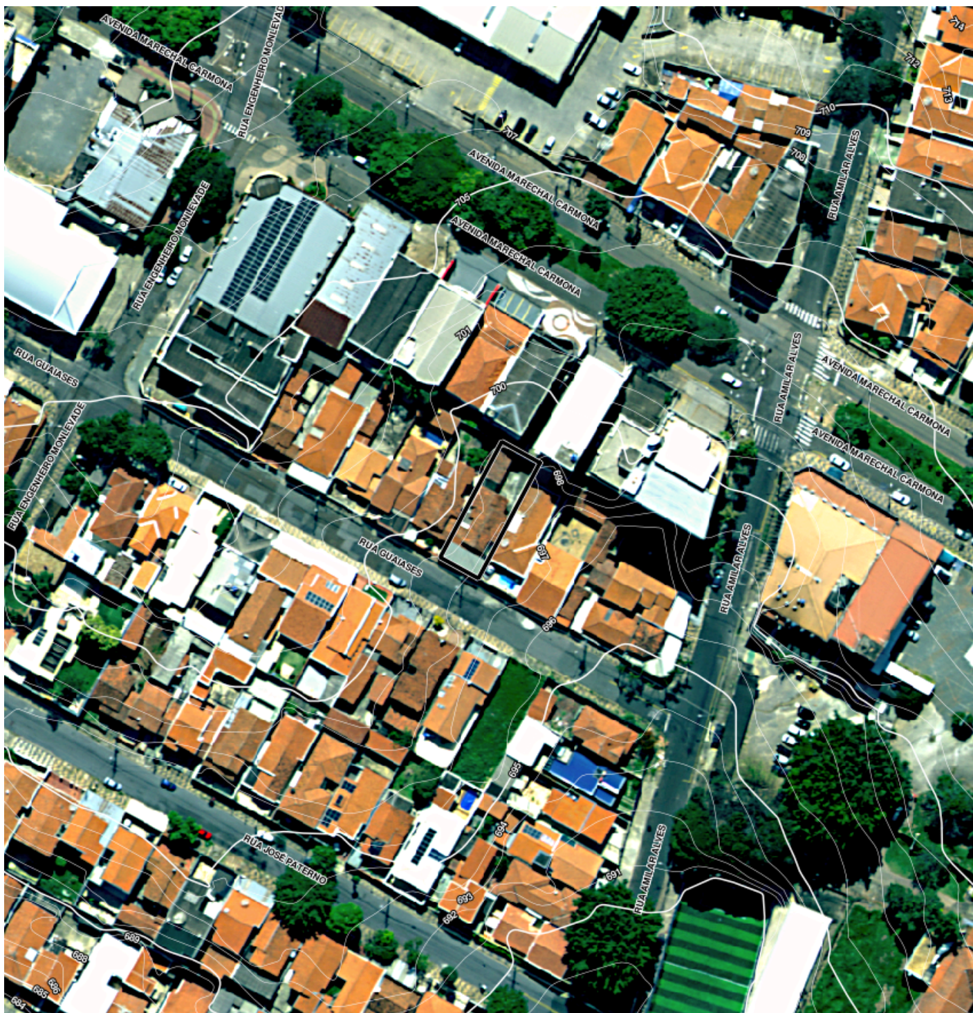
Ortofoto IGC Abr/2023 - Situação sem escala