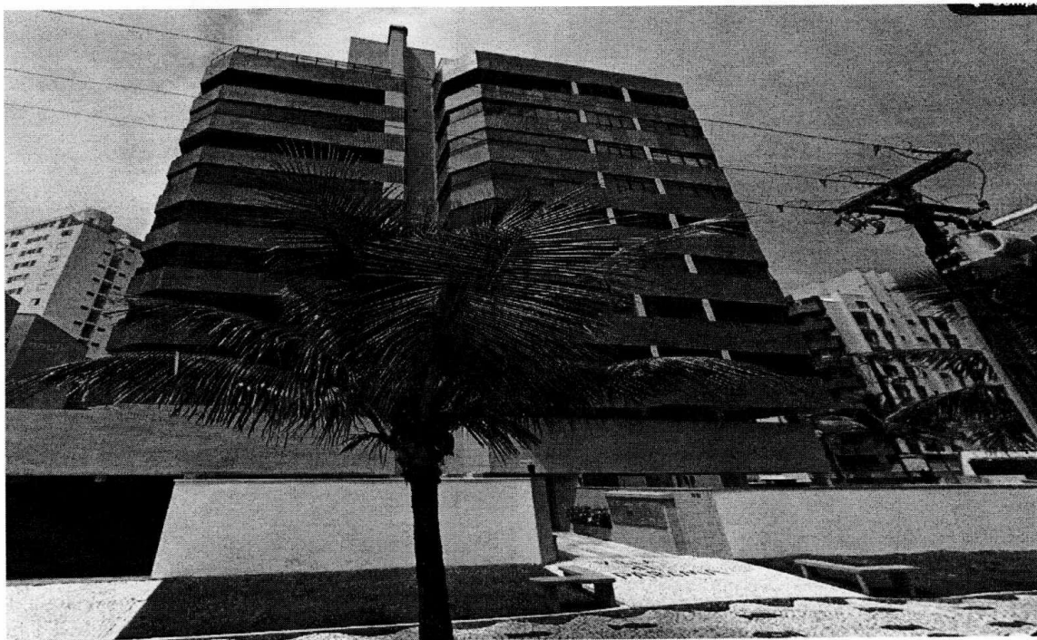
Apartamento nº 802, Condomínio Ed. Villa Di Parma, com área de 192,00 metros quadrados, segundo cadastro imobiliário, prédio de esquina, na quadra do mar, localizado na Rua Andirá, em Caiobá.