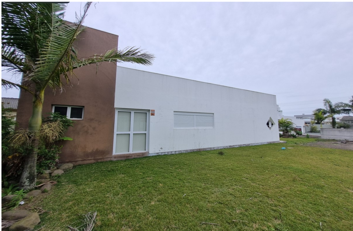
Imagem dos fundos do imóvel.

Diante de todo o exposto, avalio o terreno, cuja matrícula foi anexada ao mandado, no valor de R$ 290.000,00 (Duzentos e Noventa Mil Reais), pela localização do mesmo.