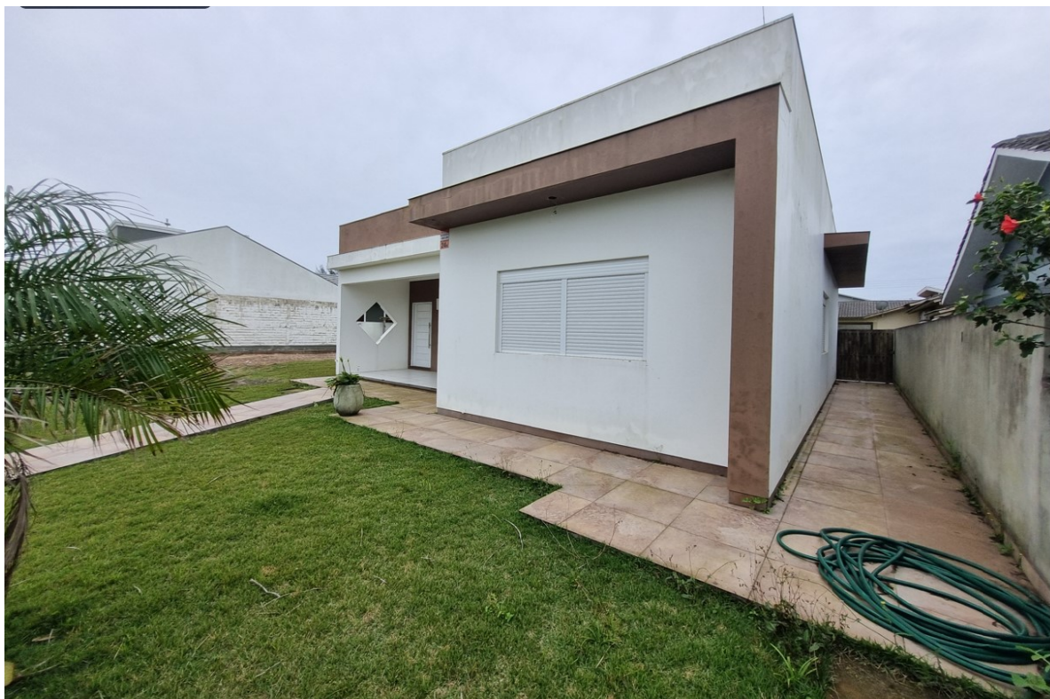
Lateral direita do imóvel