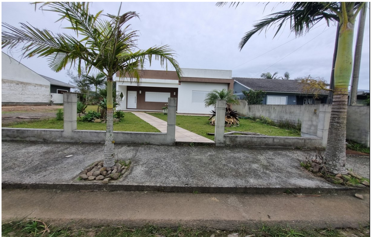
Foto da frente do imóvel, objeto de avaliação.