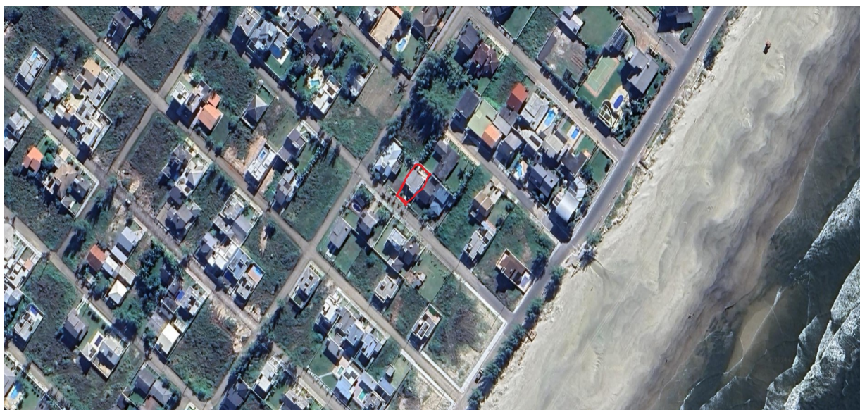
Lote 17 Quadra 5 (Ponto Vermelho -imagem Google Earth)