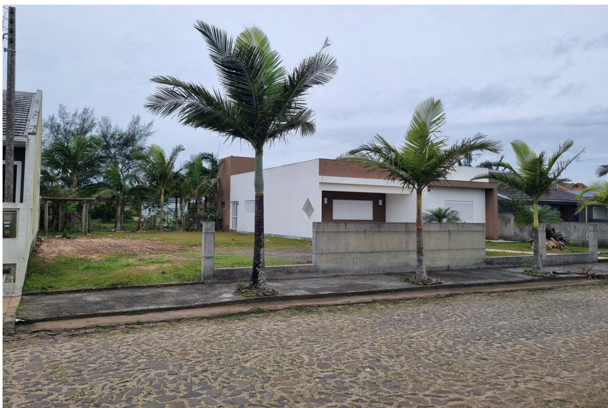
Visão da Rua das Tainhas e do imóvel